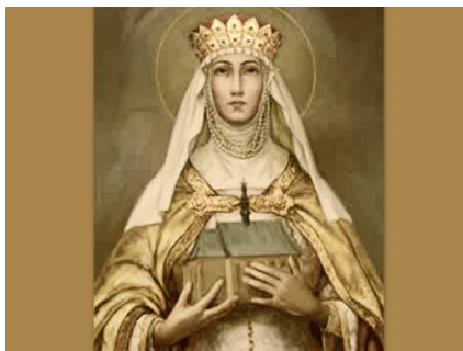
Saint Kinga of Poland (also known as Cunegunda; Polish:Święta Kinga, Hungarian: Szent Kinga) (5 March 1224 – 24 July 1292) is a saint in the Catholic Church and patroness of Poland and Lithuania