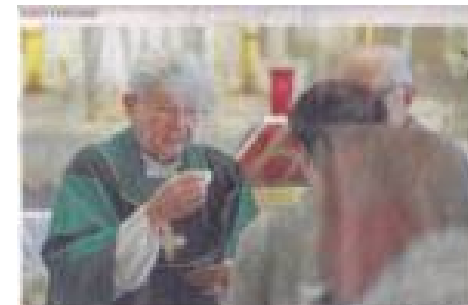
Priest's retirement may signal church's closure