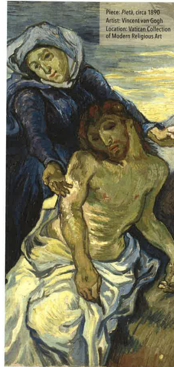
Piece: Pietà , circa 1890 Artist: Vincent van Gogh Location: Vatican Collection of Modern Religious Art

What am I struggling with and need to give over to Christ? How can I increase my trust in God this week?