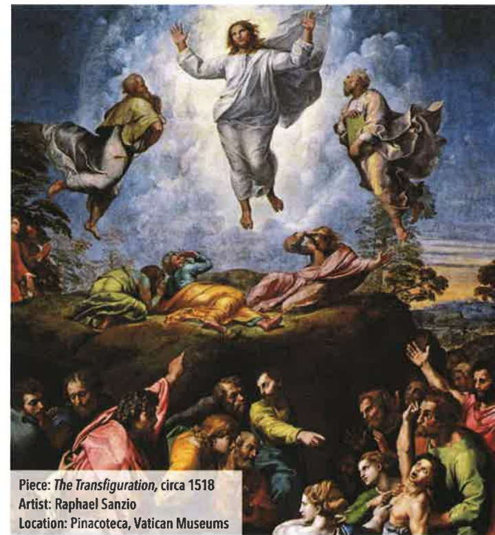
Piece: The Transfiguration , circa 1518 Artist: Raphael Sanzio Location: Pinacoteca, Vatican Museums

Here is where we need the power of God's mercy and love. Peter wanted to stay in Christ's presence and enjoy it, soak it up, remain, and never go down the mountain again. He heard the Father's voice, knew he should listen to the Son, and was resolved to do so! Although