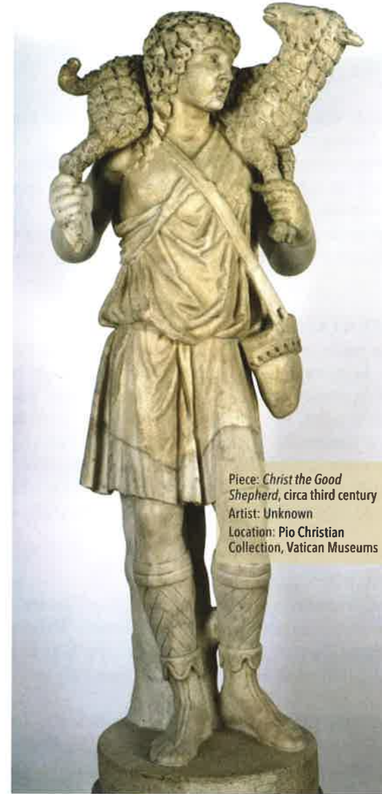
Piece: Christ the Good Shepherd , circa third century Artist: Unknown Location: Pio Christian Collection, Vatican Museums

How often do I listen to the Good Shepherd over the other messages around me? How do I stay informed of what the pope and other shepherds of the Church are saying?