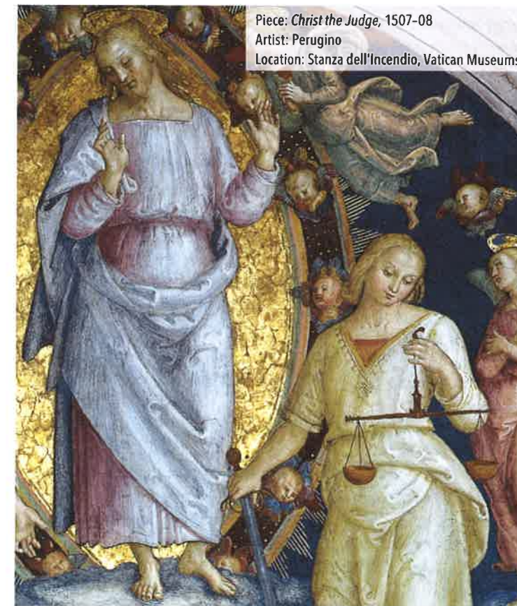
Piece: Christ the Judge , 1507–08

Remember, as Jesus said: “The measure with which you measure will be measured out to you” (Matthew