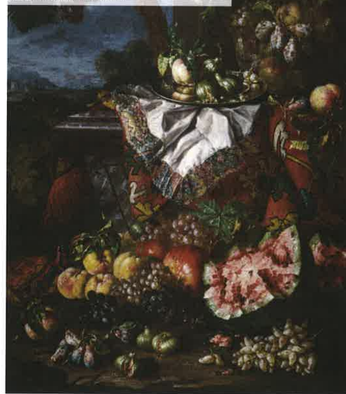
Piece: Still Life With Classical Elements, 1600s-1700s Artist: Pietro Navarra Location: Vatican Museums