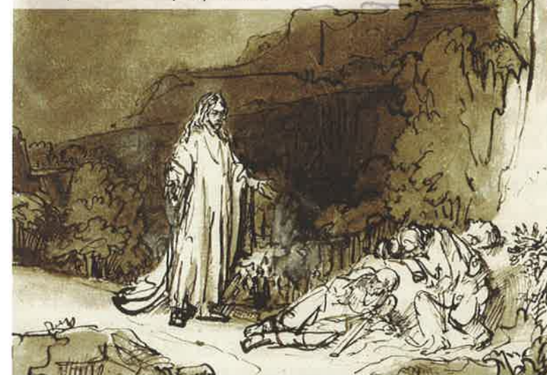
Piece: Christ Awakening the Apostles on the Mount of Olives , 1641-42 Artist: Rembrandt van Rijn Location: Collection of E.W.K., Bern, Switzerland

Jesus says to be attentive to the signs; learn to interpret their meaning. Understand them, without being distracted by them. Be vigilant, pray for strength, and stay awake and alert. Thanks be to God for those rumble strips!