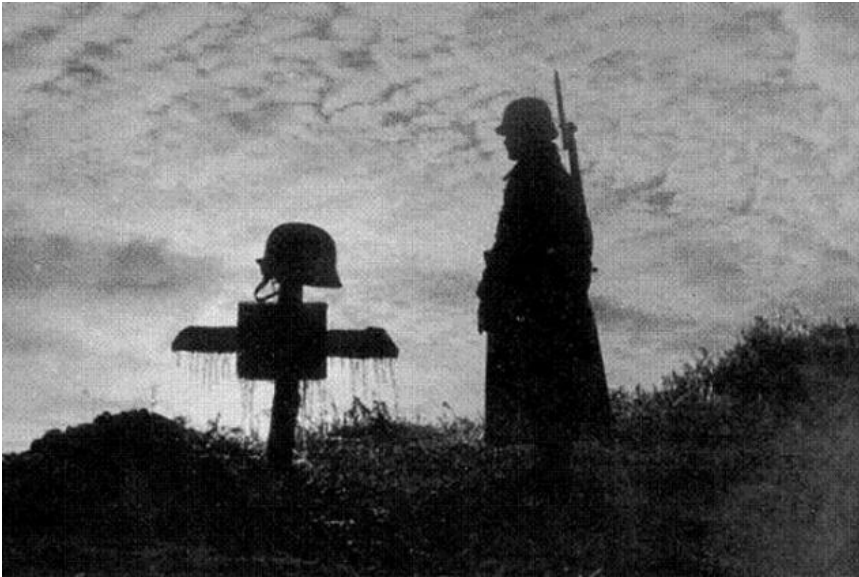
A Doni áttörés napja 1943. január 12.

Továbbra is bíztatok mindenkit, hogy a plébánia telefonszámán jelezzék, ha házszenelést kérnek, mindenkire elmegegyek!