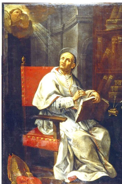
Damiani Szent Péter

Február 23. Szent Polikárp püspök és vértanú emléknapja (+155 körül). Szent János evangélista tanítványa, Szmirna püspöke, fontos láncszem az apostoli hit átadásában. A haláláról szóló írás a vértanúk legrégibb okmánya.