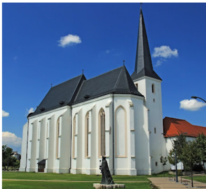
Angyalos Boldogasszony templom, Nyírbátor

Legyen ez valóban a nyugalom napja. Ha rohanó korunkban úgy érezzük, ez áldozatot jelent, hozzuk meg az áldozatot. A rendkívüli helyzetektől eltekintve ne végezzünk e napon nehéz testi munkát, ne zsúfoljunk olyan programokat e napra, amelyek még jobban kifárasztanak, mint a hétköznapok, megakadályozzák a lélek felüdülését, sőt talán még a szentmisén való részvételt is.