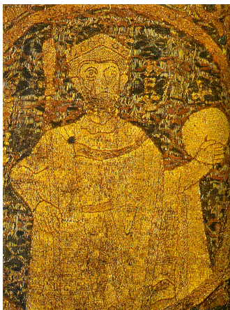
Szent István király a koronázó paláston