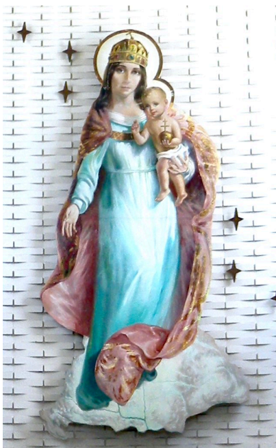
Magyarok Nagyasszonya templom, Montreal, Kanada