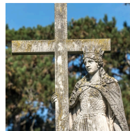
Szt. Ilona, Keszthely

Imádunk és áldunk téged Krisztus, mert szent kereszted által megváltottad a világot!