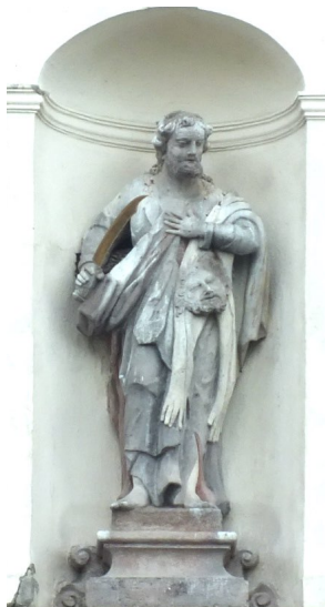
Szent Bertalan apostol Gyöngyös, Heves m.

Atyjáról nevezték így (Bartholmai – Tolmai fia); egyébként Natánael volt a neve. Fülöp vezette őt az Úr Krisztushoz. Az Úr őt apostolai közé választotta és igaz izraelitának dicsérte, akiben csalárdtság nincs (Jn 1, 44-50). S csakugyan végig tartózkodónak, megfontoltnak bizonyult. Miután azonban meggyőződött az Úr Krisztus messiási küldetéséről, teljes lelkesedéssel és odaadással szegődött hozzája. Az apostolok oszlása után Indiában (talán Etiópa határában) Mezopotámiában és utoljára Örményországban hirdette az evangéliumot. Itt megtérítette a királynak, Asztiagésnek öccsét is. A király erre halálra kínoztatta; a hagyomány szerint elevenen megnyúzatta és aztán keresztre feszítette. Erekllyei sok viszontagság után Rómába kerültek a Tiberis szigetére (983), koponyája 1238-ban Frankfurtba került. Azóta a városnak védőszentje. Több mesterség is mennyei pártfogóját, a rángatózásban szenvedők mennyei segítőjüket tisztelik benne. Ünnepe (augusztus 24.), mint az ősz kezdete, nagy szerepet visz a nép szokásaiban.