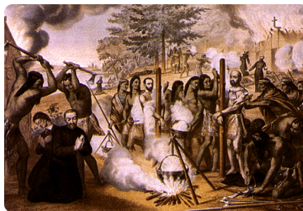
Jezsuita vértanúk kivégzése

Október 20. Kereszt Szent Pál áldozópap ünnepe. A Szent Kereszt tiszteletére alapított passzionista rend kezdeményezője. 1775-ben halt meg.