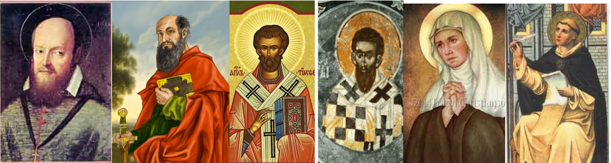
Szalézi Szt. Ferenc

Január 28-a Aquinói Szent Tamás áldozópap, egyháztanító ünnepe. Nápolyban tanult, majd Szent Domonkos rendjének tagjaként Párizsban és Kölnben folytatta tanulmányait. A középkor legtudósabb teológusa, „angyali doktor”, a skolasztika fejedelme. Egyetemi tanár Párizsban. Filozófiai, teológiai tanítása napjainkig irányadó. Az Oltáriszentség nagy hittudósa. Főműve a Summa Theologica , ebben a keresztény hitet tudományos rendszerbe foglalta.