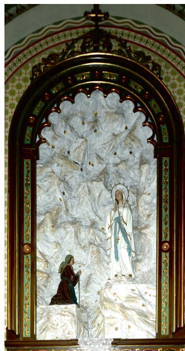
Magyarok Nagyasszonya templom, Rákospalota

Hiszem, hogy Jézus Istennek Fia. Hiszem, hogy Jézus meghalt az én bűneimért. Hiszem, hogy Jézus feltámadt a halálból az én megigazulásomért. Kérlek Jézus, jöjj a szívembe! Legyél az életem Ura, Megváltója és Gyógyítója! Jézus, Te vagy az én Uram, Megváltóm és Gyógyítóm. Köszönöm, Úr Jézus, az örök életemet és a szent véredet! Ámen.