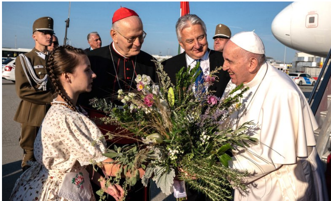
Ferenc pápa megérkezett Magyarországra - 2021

Március 13. – Ferenc pápa megválasztásának (2013) évfordulója