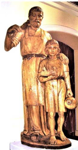
Szt. József - Nagykanizsa

Szent Péter apostol írja a házastársak kötelességeiről: „Az Isten szemében az ember rejtett énje az értékes, a szív a maga békés szelídségében és zavartalan nyugalomban” (1 Pét 3, 4). Szent József, Jézus nevelőatyja ilyen ember volt. Csendes, szorgalmas munkás volt. Kereste Mária titkának magyarázatát, de bölcs emberként belenyugodott Isten akaratába. Védte Máriát, és nevelte Jézust. Tisztelete és ünnepe Nyugaton a 14-15. században terjedt el. 1621-től szerepel a nyugati Egyház naptárában. IX. Piusz pápa az Egyház védőszentjévé nyilvánította, XXIII. János pápa pedig bevette nevét az I. Eucharisztikus imába. * Szent József példája munkára, alázatosságra, tisztaságra biztat. Kérjük őt, hogy amint gondviselője volt a gyermek Jézusnak, úgy legyen oltalmazója az ő Egyházának is. A másik kérésünk pedig az legyen, hogy Szent József boldog halálához hasonlóan Jézus és Mária álljon mellettünk is halálunk óráján.