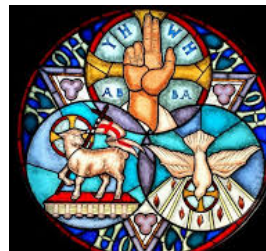
Szent Kelemen plébánia, Bük

Hadd élhessek én is Szentháromságtok fényében és melegében! A mindennapi élet hajszájában sohase feledjem, hogy a Szentháromság bennem él, s erőt ad minden küzdelemben! Ámen.