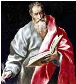
Szent Máté apostol

Szeptember 21. Szent Máté apostol és evangélista ünnepe. Kafarnaumban született, vámos foglalkozásától szólította el az Úr, hogy apostola legyen. Evangéliumát zsidó nyelven írta. Keleten hirdette az evangéliumot, a hagyomány szerint Etiópiában lett vértanú.