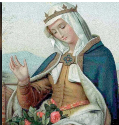
Magyar szentek és boldogok