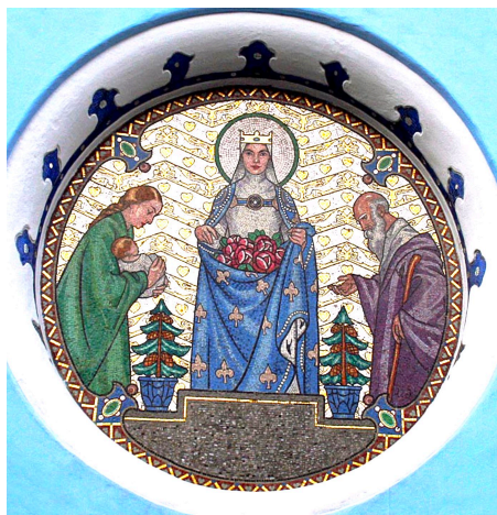
Szent Erzsébet mozaik Pozsony, Kéktemplom

A ciszterci szerzetes, Heisterbachi Caesarius így kezdi Szent Erzsébet életrajzát: „A tiszteletreméltó és Isten előtt oly kedves Erzsébet előkelő nemzetségből származott, s e világ ködében úgy ragyogott föl, mint a hajnalcsillag.” Erzsébet azok közé a szentek közé tartozik, akiknek sugárzása nem csökken, fénye minden kor minden emberének világát.