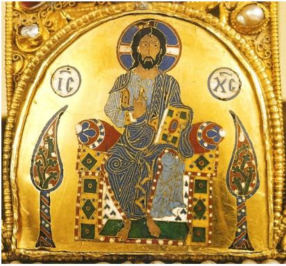
Krisztus Király a magyar Szent Koronán

Krisztus Király ünnepét XI. Pius pápa rendelte el 1925-ben, Mindenszentek ünnepe előtti vasárnapra, hogy az elpogányosodó korban, a hamis szabadoság lázongásai között az Egyház tagjait Krisztus főségének elismerésére hívja. Az ünnepet a II. Vatikáni Zsinat után áthelyezték Advent előtti utolsó vasárnapra. Ezzel az Egyház azt emeli ki liturgiájában, hogy Krisztus királysága, amely láthatatlanul állandóan megvalósul az ő híveiben („Isten országa bennetek van:”) az idők végén láthatóan is megjelenik és az emberiség történelmi útját teljessé teszi, annak értelmet ad. Méltóságunkat nem csorbítja, hanem reális alapra helyezi és kiteljesíti, ha elismerjük Isten Királyságát, amelyet átadott Fiának, Krisztusnak. Ez az ünnep évről évre hirdeti Krisztusnak az emberek és dolgok fölött való fölséges és feltétlen uralmát.