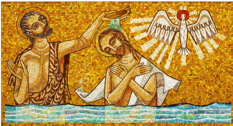
Jézus megkeresztelkedése (mozaik, Feltámadás temető, Affton, Missouri, USA, 1974)