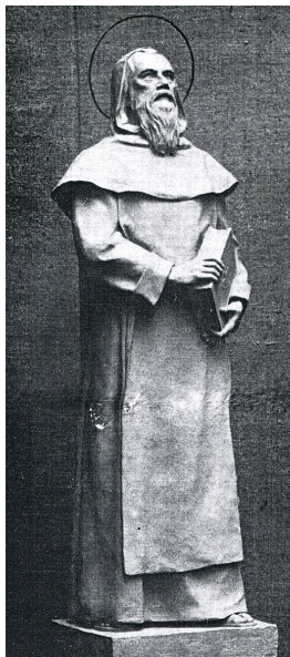
Boldog Özséb Vastagh Éva alkotása: 1930-as évek

Magyarország akkori fővárosában, Esztergomban született 1200 körül. Teremtőjéhez és Megváltójához éjjel-nappal jámbor imádságokkal könyörgött. Sokat virrasztott, és minden idejét Isten tiszteletére, elmélkedésre vagy tanulásra fordította. Érdemeiért korán esztergomi kanonoknak nevezték ki. Gyakran vendégül látta a magányos barlangokban lakó embereket, akiknek társaságát annyira megkedvelte, hogy elhatározta, ő maga is elhagyja a világot. A tatárjárás után 1245 táján társaival a Pilisbe vonult remetének. Az isteni kegyelem fényétől megvilágosítva 1250-ben a magyar remetéket egybegyűjtötte, és Esztergom közelében a Szent Kereszt tiszteletére kis templomot és monostort épített. 1262-ben IV. Orbán pápától Szent Ágoston Reguláját kérte rendje számára, amelyet azonban nem nyerhetett el a remetetestvérek nagyfokú szegénysége miatt. Ezért a pápa megbízásából Pál veszprémi püspök adott a remeteközösségnek életszabályt. Remetetestvéreivel még húsz évig élt közösségben, amelyet Első Remete Szent Pál oltalmába ajánlott. Végül testvéreit Isten és a felebarát szeretetére buzdítva és őket üdvös tanításokkal megerősítve 1270. január 20-án elhunyt az Úrban. Sírját és a Szent Kereszt monostort a törökök valószínűleg már 1526-ban elpusztították.