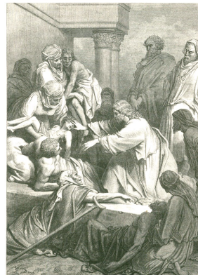
CHRIST'S MIRACLES OF HEALING