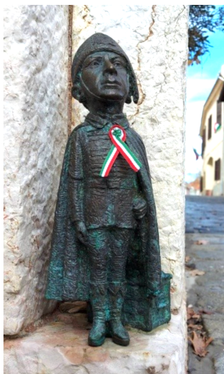
Veszprém, „Kokárdás Ernő” Kolodkó Mihály alkotása