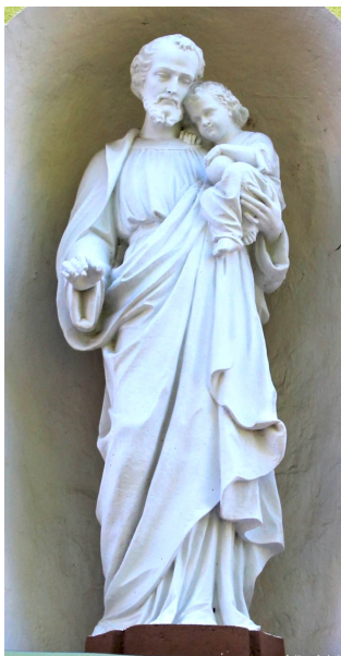
Szent József Orosztorony, Zala megye