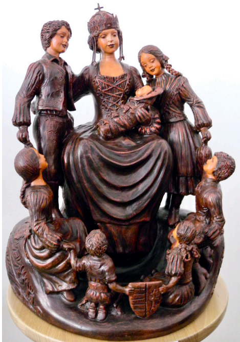
Józsa Judit: Magyarország - Anyaország

Halld meg jó Istenem, legbuzgóbb imámat: Köszönöm, köszönöm az édesanyámat!