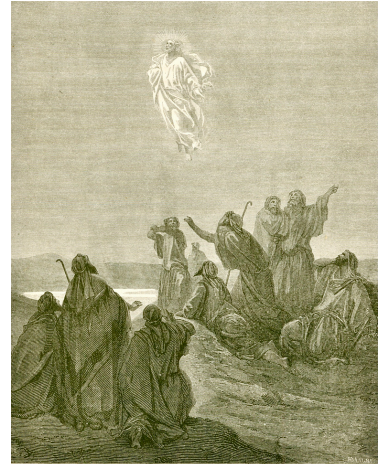
THE ASCENSION TO HEAVEN

Az Úr kivezeti tanítványait az Olajfák-hegyére és szemük láttára felemelkedik a mennybe. A tanítványokhoz hasonlóan mi is tekintünk az égre, ahonnan Krisztus újból eljön majd a világ végén.