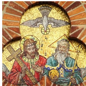
Petrovác Gyula: Mozaikkép a budapesti Szentlélek templom homlokzatán

A mai napon leborulva előtted, dicsőítelek az egész teremtett világért, és azért a teljes szeretetegységért, amelyben hárman egyként éltek. Hadd élhessek én is Szentháromságtok fényében és melegében! A mindennapi élet hajszájában sohase feledjem, hogy a Szentháromság bennem él, s erőt ad minden küzdelemben! Amen.