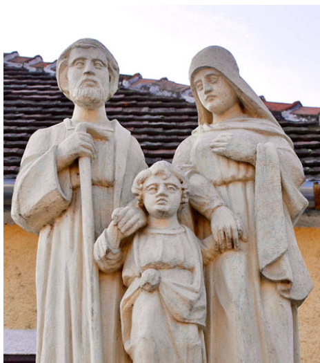
Hegykő, Sopron vm, Szt. Család szobor Állította Zsirai Ágnes 1915-ben

Te nevelőapa voltál, és minden apa védőszentje vagy. A Mennyei Atya, akitől minden atyaság származik, rád bízta egyszülött Fiát, és önmaga helyettesévé állított Jézus mellé. Te ezt a méltóságot úgy gyakoroltad, hogy Jézus büszkén mondhatott atyjának, amit az ő boldogságos anyja, Szűz Mária is elismert.