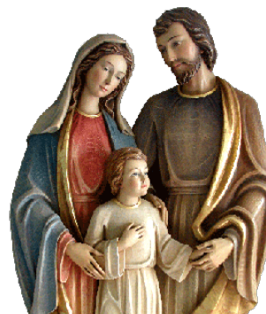
Szent Anna és Szent Joakim