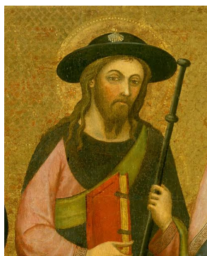
Szent Jakab apostol