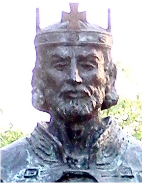
Szent István szobor Budapest Sashalom

A keresztény embernek a világ forgatagában kell élnie. De nem szabad feladnia elveit, nem hasonulhat a (bűnös) világhoz, ellenkezőleg meg kell szentelnie azt. Ezt a feladatot akkor is vállalunk kell, ha áldozatot követel tőlünk.