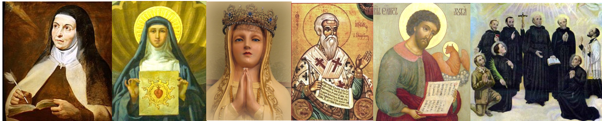
Avilai Nagy Szt. Teréz

Október 19-e , szombat Brébeuf Szent János, Jogues Szent Izsák áldozópapok és társaik vértanúk ünnepe. Észak-Amerika térítői, 1647 és 1648 között haltak meg.