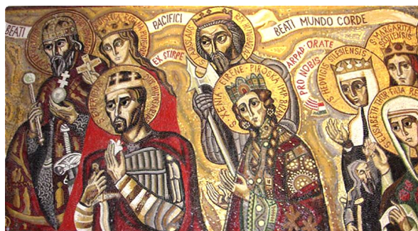
Magyar szentek és boldogok