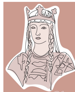
Skóciai Szt. Margit

Istennek minden szentjei, könyörögjétek érettünk!