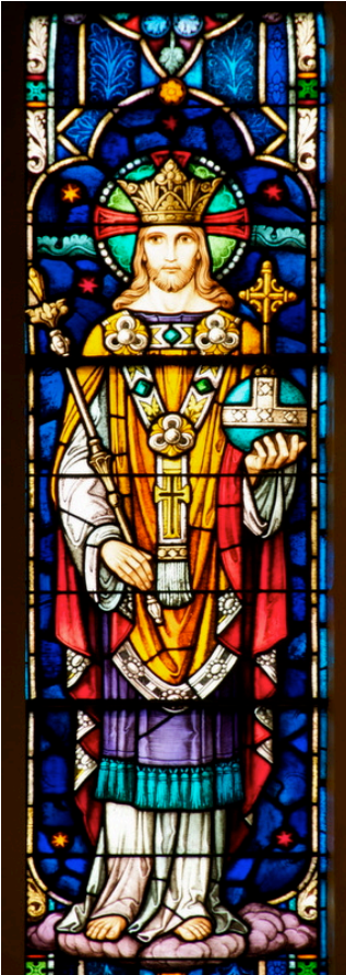
Passaic, Szt. István templom

Hogy a Te örök szeretetedre rendeltél: Hála Istennek!