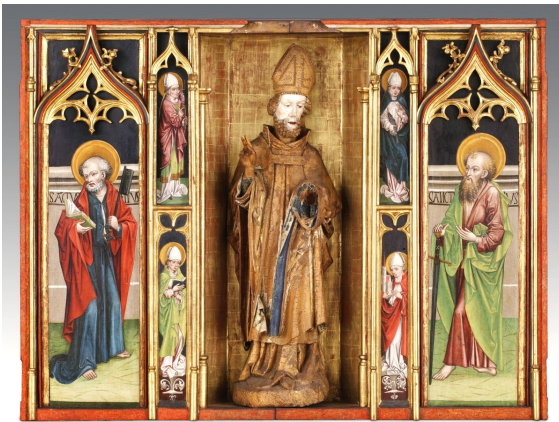
Szent Miklós oltár a jánosréti Szt. Miklós-templomból; Magyar Nemzeti Galéria

Görög földön élt a IV. században. Myra püspöke, az igaz hit rendíthetetlen védelmezője a niceai zsinaton a tévtanítókkal szemben. Ugyanakkor a jótékonyság és az ajándékozó lelkület szentje, adventben az üdvösség ajándékát hozó Üdvözítő előhírnöke. A keleti egyház egyik legtiszteltebb szentje. Nyugaton a X. század óta tiszteli a liturgia és a népi áhítat. Életét a középkorban színjátékszerűen is előadták, ennek származéka ma is a gyermekek közé jövő, őket hittan-tudásukról és életmódjukról megvizsgáztató Szent Miklós-alak („Mikulás”). A kíséretében levő „ördög”-figura a szent legendájának arra a mozzanatára emlékeztet, amikor a Sátán támadásait és cseleit híveitől több ízben is elhárította.