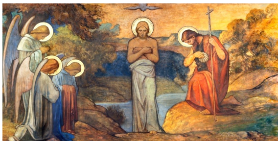
Jézus megkeresztelkedése S. G. Rudi freskóképe a prágai Szent Vencel templomban