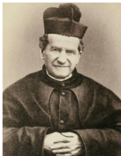
Bosco Szent János

Január 28-a Aquinói Szent Tamás áldozópap , egyháztanító ünnepe. Nápolyban tanult, majd Szent Domonkos rendjének tagjaként Párizsban és Kölnben folytatta tanulmányait. A középkor legtudósabb teológusa, „angyali doktor”, a skolasztika fejedelme. Egyetemi tanár Párizsban. Filozófiai, teológiai tanítása napjainkig irányadó. Az Oltáriszentség nagy hittudósa. Főműve a Summa Theologica , ebben a keresztény hitet tudományos rendszerbe foglalta. (+ 1274)