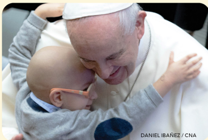
DANIEL IBAÑEZ / CNA