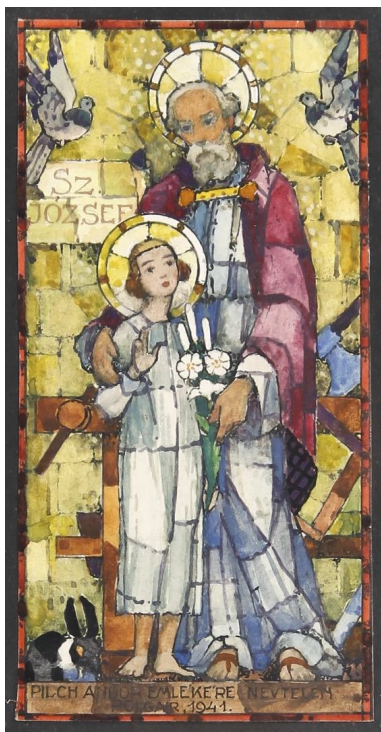
Pécsi-Pilch Dezső: Szent József a kis Jézussal üveglablak tervezet, 1941

Egyetértés, hű szeretet egyesítse szíveinket. Az ég felé mutass utat, gyámolítsd az ellankadtat. Küzdelmünkben légy segélyünk, éreynyekben példaképünk. Átadjuk a ház kulcsait, oltalmazd és védj lakóit. Zárd ki mindazt, ami káros, ami üdvünkre hátrányos. Engedd be az isten-áldást, minden jóban gyarapodást. Ajánlj minket Jézusodnak és szeplőtelen Szűz Arádnak, hogy családunk kisedd háza Názáretnek legyen mása. Ámen.