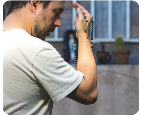
ALFONSO / CATHOPIC

Left-handedness is no longer associated with evil. If you wish to make the sign of the cross with your left hand, you may. But do consider why you are doing it. Most left-handed people have no trouble using their right hand for many simple tasks. If your purpose is a bit rebellious, maybe realize that signifying unity with your brothers and sisters in Christ is more important. ●