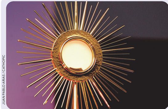
JUAN PABLO ARIAS / CATHOPIC